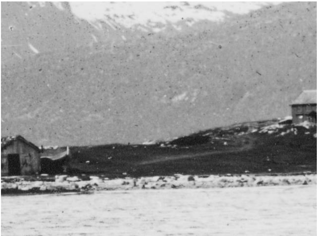
Utsnitt av foto tatt av Kanstad

I fra vestsnippen av Karnhaugen, tidligere kalt Kjærringrauva, så delte sjøveien seg straks "i to", en vei til hvert naust. Den ene vestligste gren går rett fram, eller sør, til østsiden av Hans-Olai-naustet,