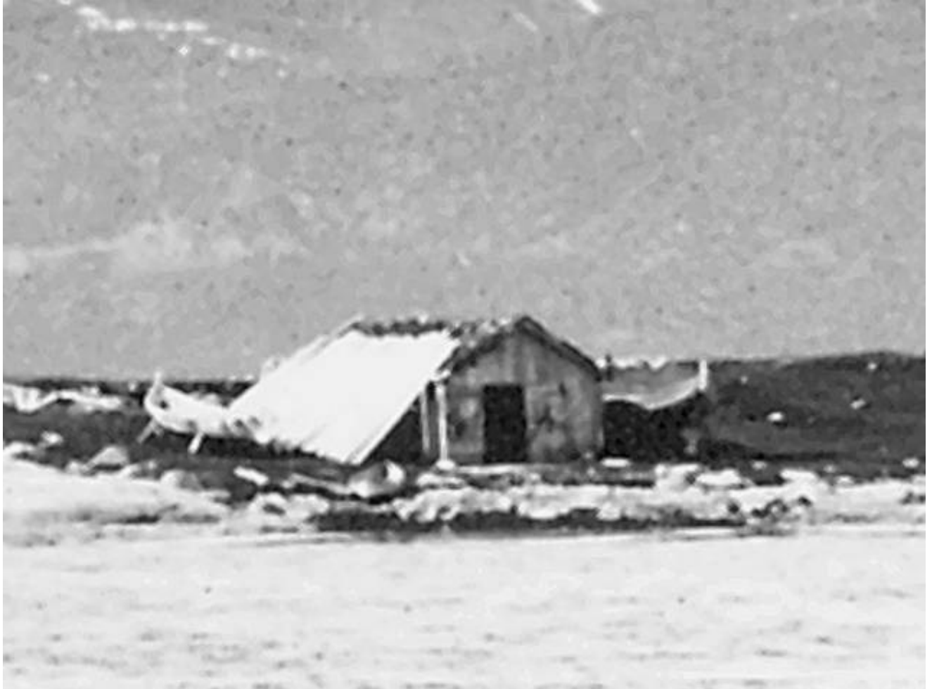
Utsnitt av foto

Det vender mot aust. Man ser tre båter utenfor, den ene ligger, eller står, oppsett i støa i almindelig flomål, gjevnsides med "flatsteinen" i nordsida av støa. Den er fint oppskora.